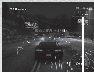
ペナルティタイム

仲間が違反車両を追い詰めているので、規定時間内に仲間の場所までたどり着いてください。レーサーはいませんが、一般車両は走っているのでよけながら進む必要があります。壁にぶつくと2秒、一般車両にぶつくと3秒のペナルティタイムが加算されます。クラッシュした場合のペナルティはありません。